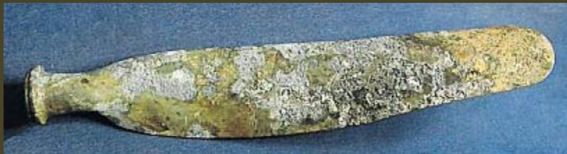
Propellerblad van de op 24 aug. 1944 neergestorte Amerikaanse bommenwerper, die in Aasterage heeft gehangen en nu in bezit van het Verzetsmuseum is.

Een propellerblad heeft jaren in Aasterage, de basisschool aan de Ringweg, gehangen als een stille getuige van dit drama. De navigatie van de vliegtuigen was toen niet op dat niveau van vandaag. Ze waren vaak erg kwetsbaar, vooral bij slechte weersomstandigheden. Zo stortten bijvoorbeeld 15 Duitse jagers op 18 oktober 1943 neer boven noord Nederland door slecht zicht.