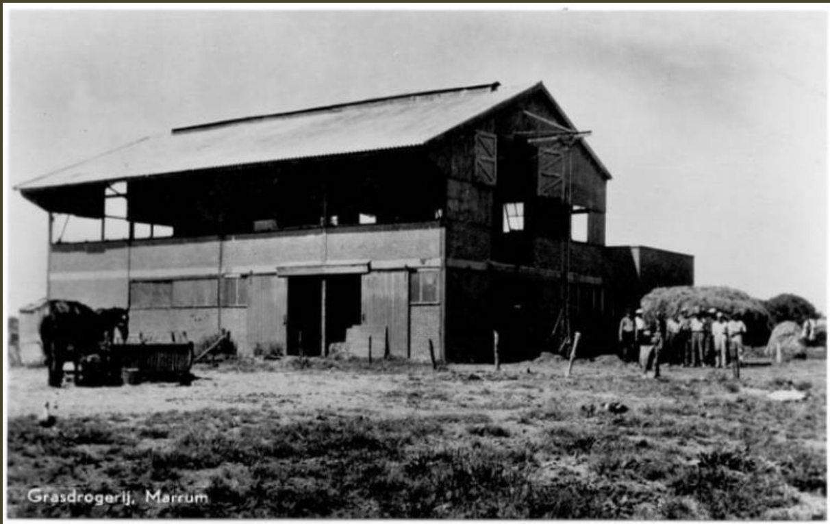
De in 1941 gebouwde grasdrogerij aan de Stasjonsstrjitte. In de oorlog werd hierin een centrale keuken gevestigd.

Er was censuur op kranten, en alles wat gedrukt werd, en in de pas gebouwde grasdrogerij aan de Stationsstraat werd een centrale keuken gehuisvest, daar kon je aardappelen of snert krijgen, om zo thuis brandstof te sparen. Maar dit was letterlijk uitschot en meer als veevoer geschikt. Mensen die verdacht werden van verzetsdaden, werden gearresteerd en afgevoerd, evenals mannen die waren aangezegd om in Duitsland of Drenthe te werken, maar niet kwamen opdagen. Het fenomeen 'onderduiken' werd veelvuldig toegepast, zowel van mensen van elders als hiervandaan. Kortom, enige vrijheid van doen en laten, was geheel verleden tijd.