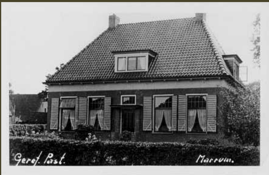
Foto van de Gereformeerde pastorie aan de Lage Herenweg. Deze werd vanaf 1944 gevorderd door de Duitse bezetters

In 1943 gebeurden er veel dingen te Marrum in negatieve zin. Na het vertrek van Ds. van Harmelen werd de Gereformeerde pastorie gevorderd door een Duitse bezettingseenheid. Vanaf toen zag je geregeld een patrouille daarvan op de fiets onze dorpen afstruinen, meestal vergezeld van een hond. Sommigen waren echter zo beroerd nog niet, ook zij zagen uit naar het eind van de oorlog en wilden graag naar huis. Maar hun commandant hield de wind eronder, waardoor er af en toe dorpsgenoten werden afgevoerd, vaak met onbekende bestemming. Een aantal hiervan werd na een korte tijd weer vrijgelaten, maar anderen keerden niet terug. Gerrit Zeemans werd op 7 augustus 1943, thuis neergeschoten, evenals Theunis Looyenga op 19 januari 1944. Wat de laatste betrof, hierbij speelde verraad helaas een grote rol, maar ook onvoorzichtigheid.