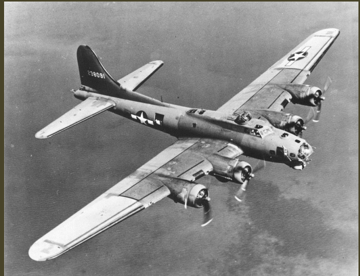
B-17 Flying Fortress bommenwerper